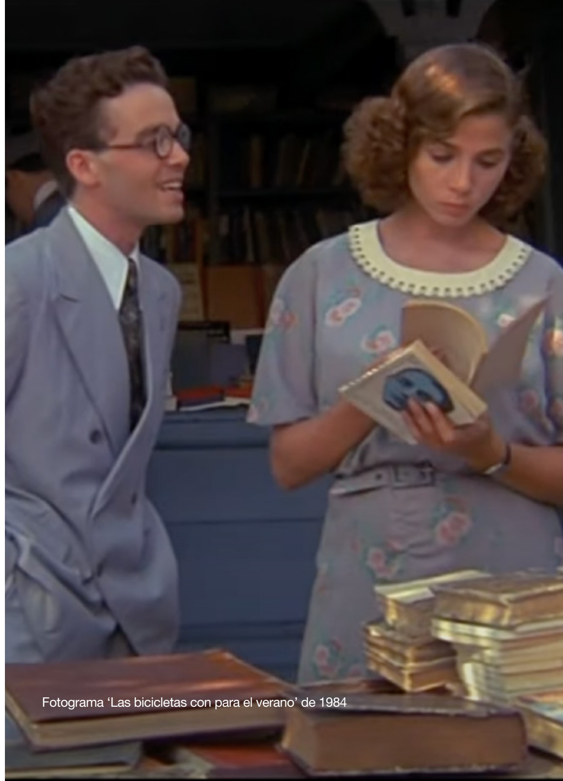
Fotograma 'Las bicicletas con para el verano' de 1984

Durante los años 2025 y 2026, en bibliotecas del Ayuntamiento de Madrid de distintos distritos, una exposición recorrerá la historia centenaria de la Feria de libros permanente de Madrid en la Cuesta de Moyano a través de una selección de fotos históricas desde 1925 hasta hoy.